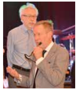
Gratulationer framfördes av föreningarna Rävetofta, Lund, Kontinent och Silva