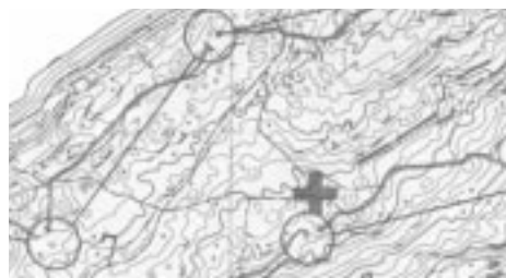
Karta över del av Bettmeralp

Så var det vilodag och förflyttning till 4:e etappen och de södra delarna av Schweiz och Grimselpass, 2500 meter över havet. Snön låg fortfarande kvar. På sina ställen t.ex. som glaciär men även fläckvis så det var bakhalt och glatt. Det trevliga med denna etapp var att man kunde följa löparna på sin jakt efter kontroller. Alpin terräng, totalt fri sikt efter som vi var ovanför träd- och buskgränsen. "Kolla på den, nu springer han fel" och andra glada tillrop.