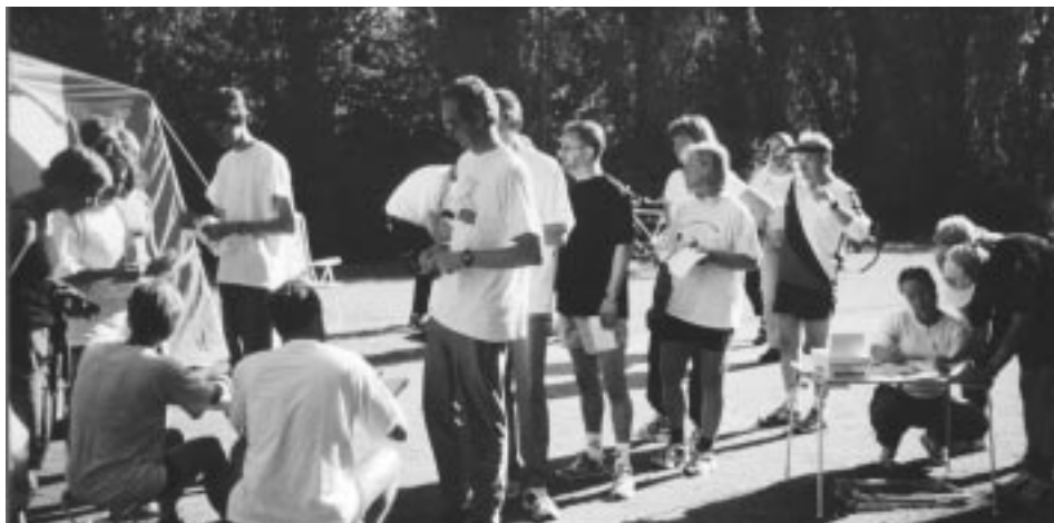
Många hade mött upp för en fajt med den "vilda terrängen" i Pildammarna

Ribersborg var nog den jobbigaste etappen, både fysiskt och psykiskt. Här blandades hela samhället. SSU hade kongress med 20 000 deltagare från hela världen. Rika och fattiga sprang, cyklade och promenerade. Några t.o.m. badade. Mitt ibland dessa sprang orienterarna fram. De långa sträckorna längs med stranden tog knäcken på mig efter att jag