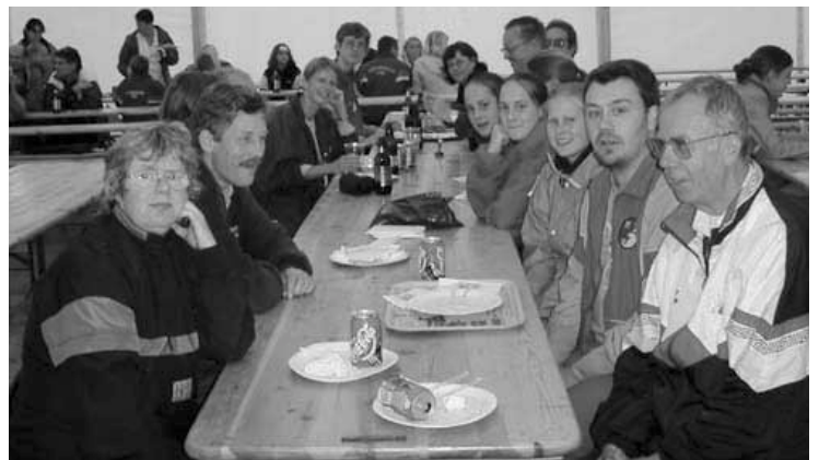
MOK-gänget samlat för mat och prat på torsdagkvällen