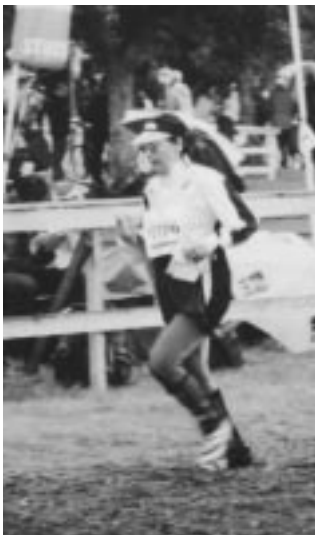
Anita forsande fram i leran

Först bär det av mot Gränna, André museét och Visingsö som mål. Vi anländer framåt kvällen och det gör även regnet. Gränna kan sammanfattas med André museét, solnedgång, regn och falska förhoppningar (dessa återkommer jag till).