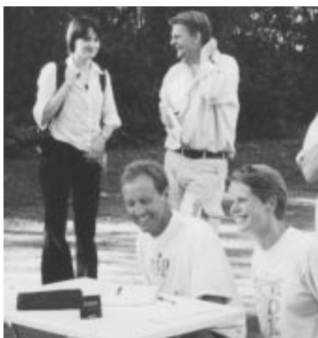
Reportrarna från SDS gästade oss i Pildammarna och skrev en fyllig artikel om vår park-OI

Ytterligare information finns på vår hemsida www.mok.nu