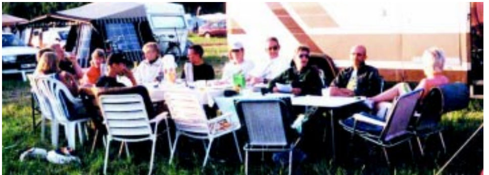
Hela MOK's O-ringens-elit samlad.

"De kanske trodde du kom från TV och skulle filma campingen", sa jag och sneglade på texten som täckte bilens långsidor: "SUCCESS, en film". Hon sommarjobbade denna sommar