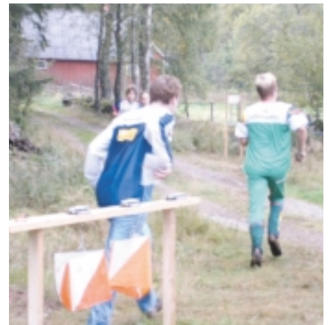
Sista kontrollen sen spurten