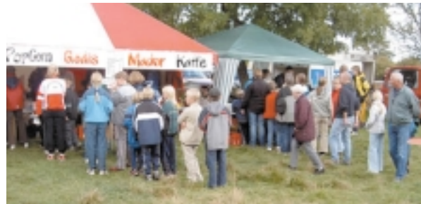
Ungdomar i kö till MOK:s "Godistält".

intresse hjälpt till. Alla lika viktiga för slutresultatet. Somliga funktioner är dock svåra eller omöjliga att fördela på flera händer och kräver speciella kunskaper, t.ex banläggningen, kartrevideringen, datafunktionen, planeringen och materialansaffningen och uppbyggandet av ett funktionellt TC och markan. Ansvariga för dessa funktioner har fått bära ett tyngre lass än andra.