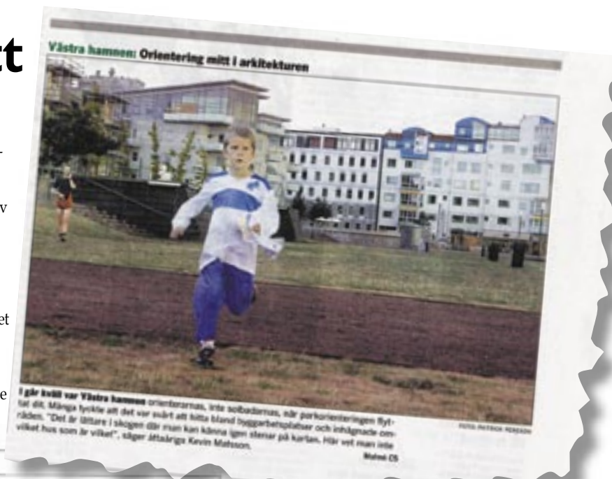
SYDSVENSKAN Onsdag 9 augusti 2006

Deltagare från när och fjärran är glädjande också, från Trelleborg i söder till Umeå i norr, plus en del utländska orienterare från tex England och Vietnam, för att inte glömma våra motorcykelåkande vänner från Tilsvilde i Danmark som kommer troget varje tisdag.