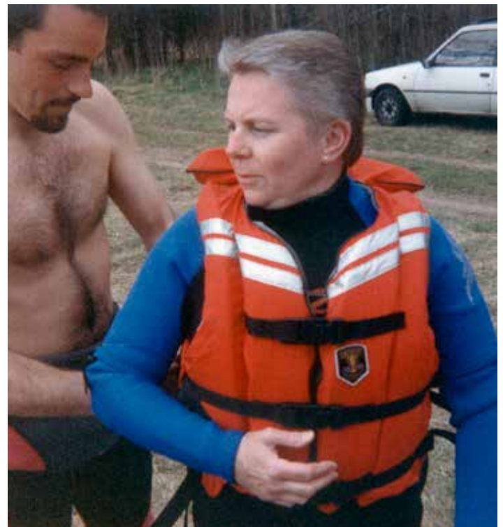
Gunnel med påklädare.

Hur många grader det var i vattnet vet jag inte men svalt var det säkert, eftersom det