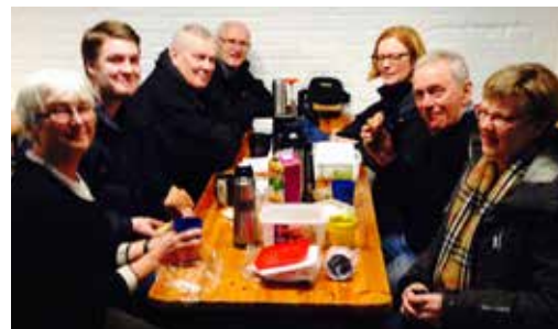
En del av tävlingsstaben samlad

En del samtal senare bestämdes det att jag fick ta hand om denna revidering och den utfördes i december och januari samtidigt som jag också skissade på banorna. Under tiden togs också kontakter med olika personer