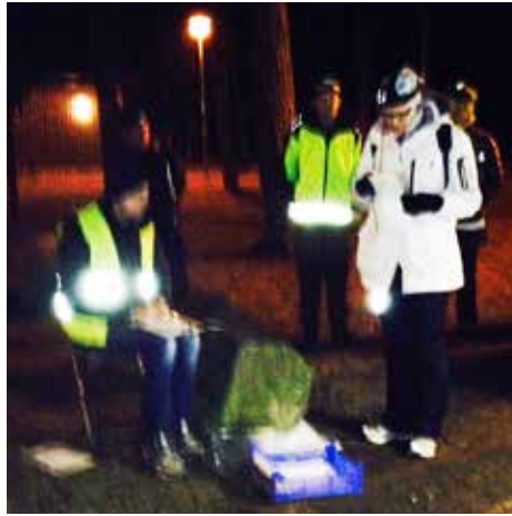
Starten har gått