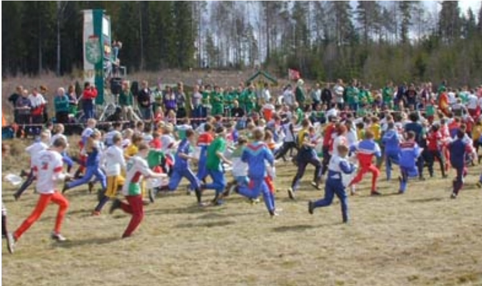
Starten har gått i ungdomsklassen.