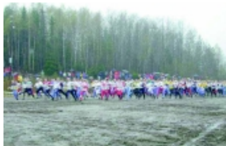
Starten har gått!