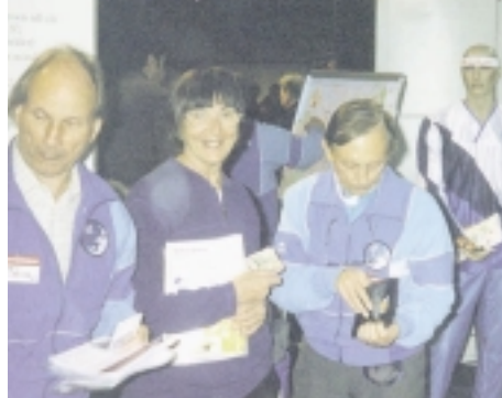
MOKs engagerade Naturpass försäljare

ningar i Bokskogen de sista veckorna. Vi tar betalt för våra insatser och material typ kartor.