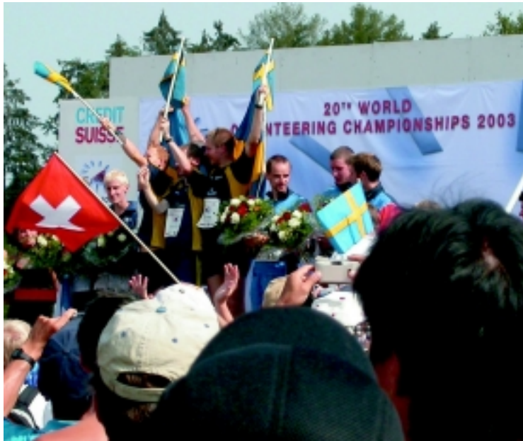
Sveriges segrande lag i stafetten