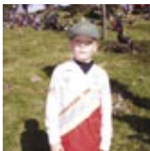
Tävlingens äldste och yngste deltagare